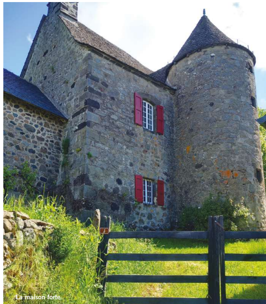
La maison forte

La maison forte - Elle se rattache à un type d'origine médiévale, largement répandu en France: bâtiment rectangulaire à étage ayant en façade une tour cen-