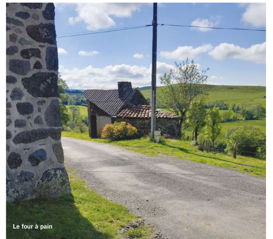
Le four à pain

Les habitants - Actuellement, une seule maison est habitée toute l'année par la famille Dufayet.